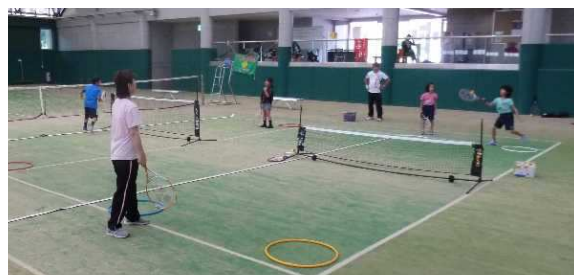
昨年の教室の様子

申込方法 (1) 下記の申込先（三次市テ ニス協会事務局）まで、電話、ファックス、メールでお願い します。 (2) ラケット、ボール等は、主催者で用意します。 (3) 動きのしやすい服装で、運動靴の着用をお願いします。