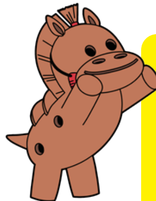
みよし風土記の丘ミュージアム マスコットキャラクター ハニワだもん