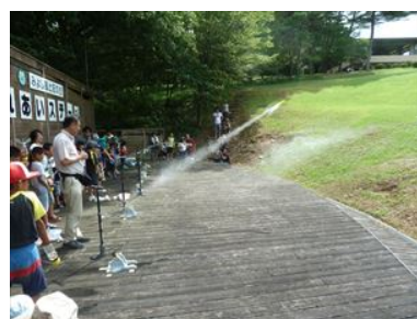
ペットボトルロケットを飛ばす