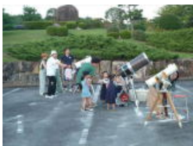
天体観望会 三次ふどきの丘

ホームページ: http://mistee.b.la9.jp/ (MISTEEで検索: 最新情報、過去活動等を記載)