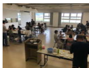
自由研究相談会 木炭電池