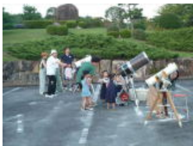
天体観望会 三次ふどきの丘

ホームページ： http://mistee.b.la9.jp/ (MISTEEで検索：最新情報、過去活動等を記載)