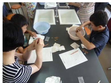
10 円玉を浮かす 科学体験