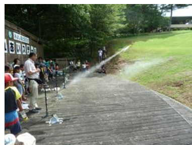
ペットボトルロケットを飛ばす