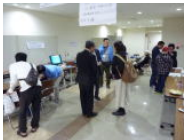
商工フェスティバル 活動紹介