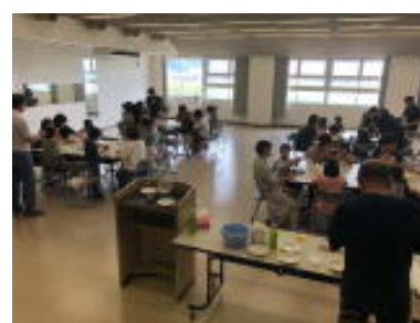
自由研究相談会 木炭電池